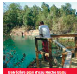
Belvédère plan d'eau Roche Ballu