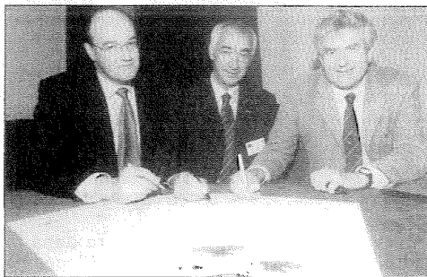
Signature de la charte unissant la WDA et la CBI of Wales à l'Union des entreprises pour l'Ille-et-Vilaine.

Après CORK en 2000 et CADIX l'an dernier, le 3 e Rallye Europe a fait cette année étape au Pays de Galles dans le comté de CARDIFF.